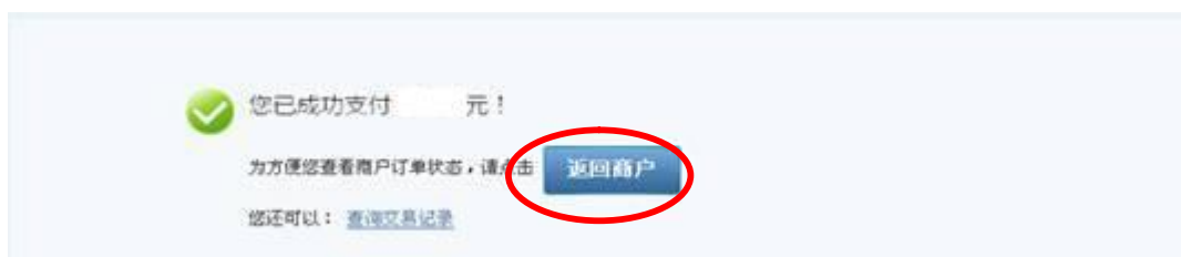
图 4 网银交费完成后提示页面