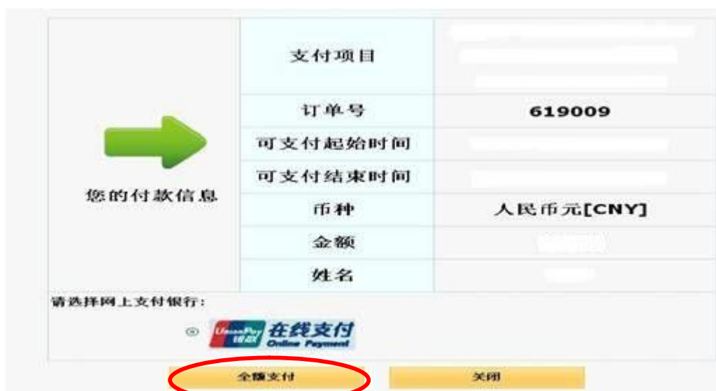
图 2 河海大学收费服务管理系统付款平台