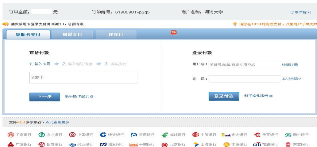
图 3 网银支付选择界面